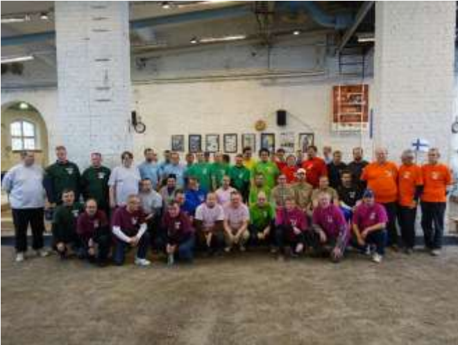
Yhteisotretti Finnish Masters 2016 16 joukkuetta.

Lauantaina 6.2. pelattiin Helsingin Pasilan Veturihalleilla Finnish Masters 2016 kilpailu.