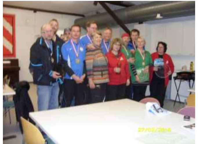
2016 Hallitrippelin A-sarjan parhaat.

27.2.2016 pelattiin perinteinen Hallitrippeli Iittalan Iskuasemalla. Tapahtuma järjestettiin jo viidettä kertaa ja joka kerta se on myös ollut "loppuunmyyty" niin siis tälläkin kertaa. Täksi vuodeksi lisättiin osallistujamäärä 16 joukkueesta 20.